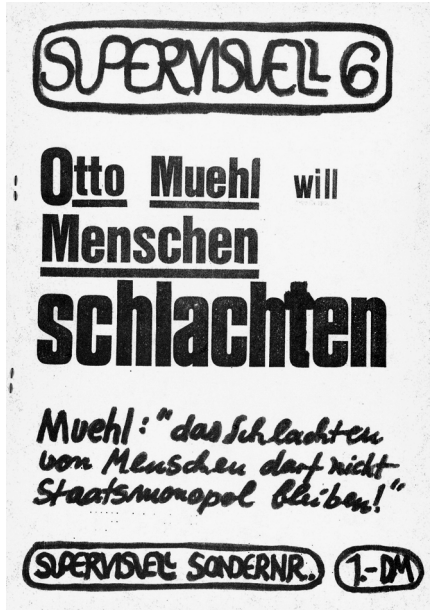
2-5 Titelbilder der Supervisuell-Ausgaben 1, 2, 3 und 6