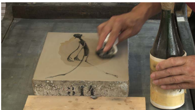
Schang Hutter, Lithografie