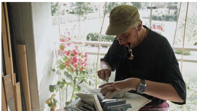
Boris Mlosch, Stein-Skulptur